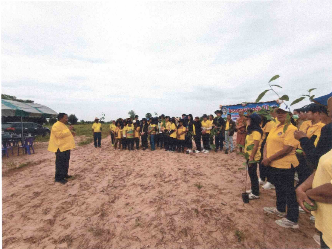
ภาพที่ ๓ กล่าวเปิดโครงการโดยนายกองค์การบริหารส่วนตำบลป่อใหญ่