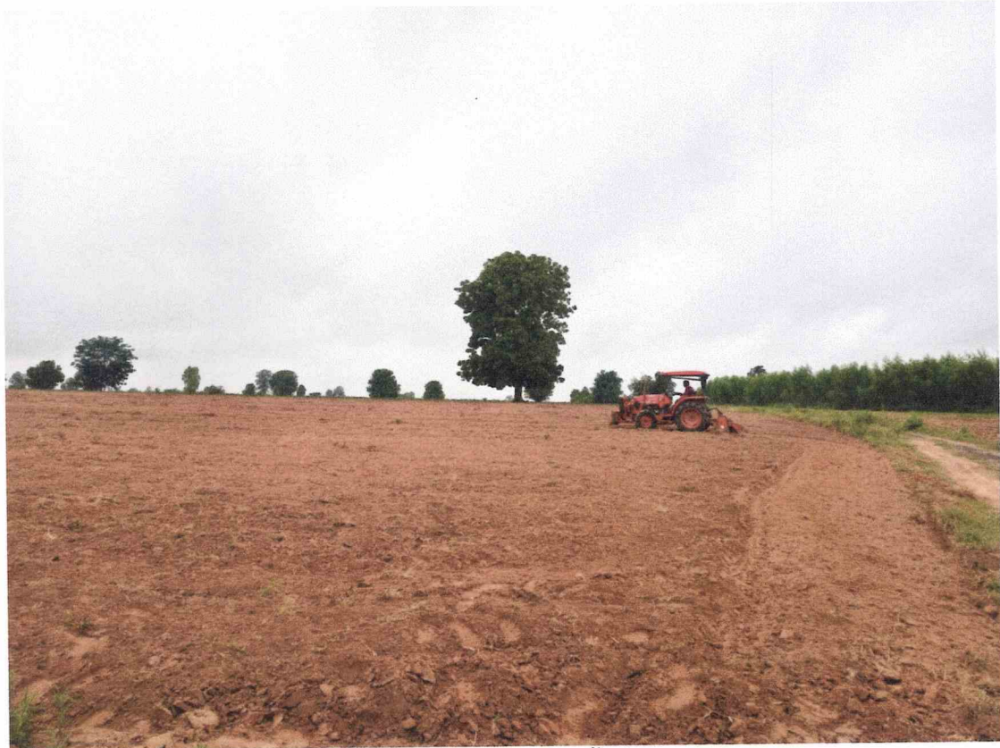
ภาพที่ ๑ การเตรียมพื้นที่