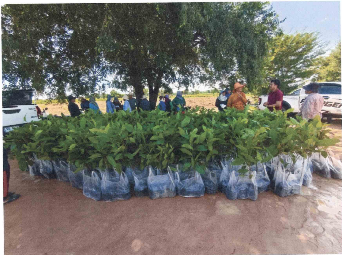
ภาพที่ ๒ ต้นยางนา